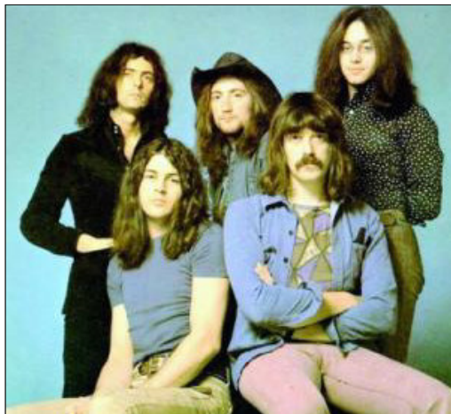
Ritchie Blackmore, Ian Gillan, Roger Glover, Jon Lord et Ian Paice. Dans l'histoire d'un groupe qui a connu de multiples changements de personnel, ce line up, baptisé « Mark II », reste celui qui aura permis à Deep Purple d'entrer dans la légende.