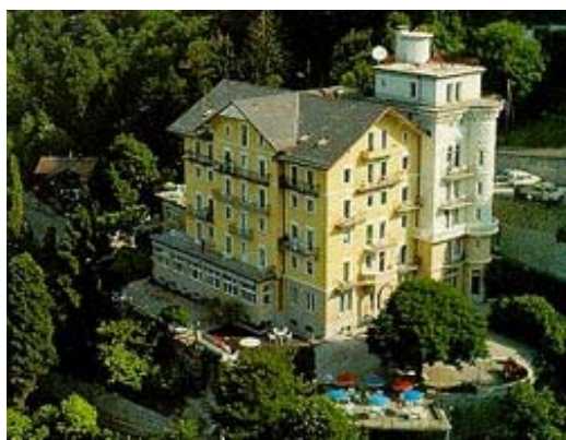
SURVAL MONT FLEURI 56, rte de Glion CH 1820 Montreux Suisse

Le bâtiment se situe sur les hauteurs de Montreux et convient spécialement à des personnes arrivant avec leur voiture (parking gratuit) ou disposées de rentrer en taxi à la fin de la journée. Une course de taxi du centre de Montreux jusqu'à Surval sera facturé environ CHF 25.- (ou €16.-) et peut être partagée par 3 ou 4 personnes.